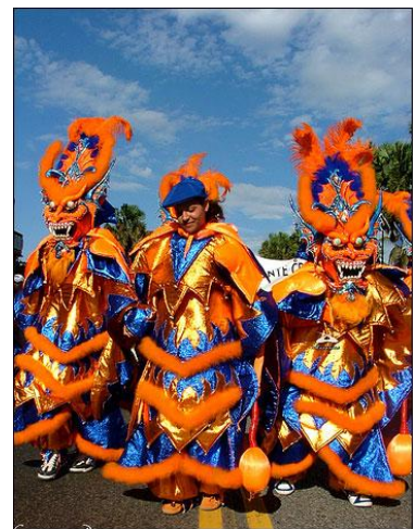
Carnaval de República Dominicana

En el país, existen algunos carnavales de origen más africanos y cuyas celebraciones generalmente no están relacionadas ni con las carnestolendas ni con las fechas patrióticas. Estos carnavales son conocidos como "carnavales cimarrones" y el más conocido de ellos es el de Cabral, que se celebra en Semana Santa. Comienza el Jueves Santo y es llamado de esa manera debido a que se realiza en lugares donde ocurrieron movimientos cimarrones por parte de esclavos africanos que se alzaron en busca de su propia identidad y libertad. El Carnaval Dominicano es una de las tradiciones más coloridas y celebraciones más alegres de la República Dominicana.