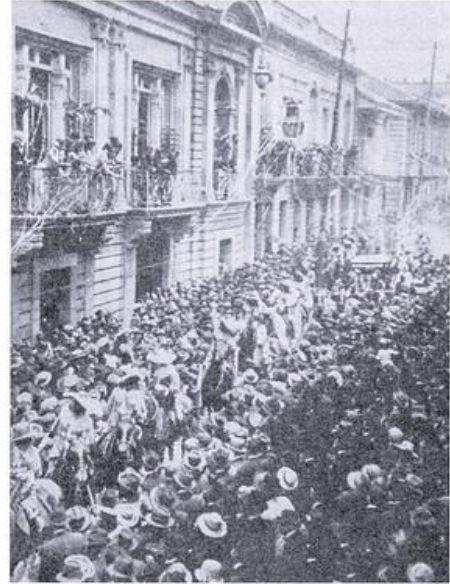
Carnaval de la Universidad Nacional en 1924.

Así pues en el año de 1924 la Universidad Nacional de Colombia celebró su primer carnaval. Entonces no había campus y los desfiles se realizaban por las calles del centro de la capital, siendo la carrera octava el centro de los festejos. No menos de 500 vehículos participaron en medio de serpentinas y claveles. En cuanto a lo económico, no se ahorraron esfuerzos: se invirtieron 50 mil pesos en claveles y 5 mil en serpentinas.