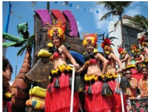
Carnaval de Veracruz 2011

Es celebrado desde 1925 en Veracruz. El sábado se realiza el primer gran desfile o paseo en la noche, asimismo se realizan el domingo en la mañana y la tarde, el lunes en la tarde, y el martes en la tarde y en la noche. En los paseos hay gran variación de carros alegóricos y comparsas. El miércoles de ceniza, se termina el carnaval con "El entierro de Juan Carnaval", donde se lee un testamento y se entierra a dicha celebridad.