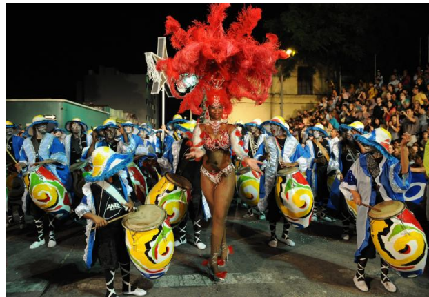
Desfile las "llamadas"

Es la fiesta popular por excelencia, considerándose además el más largo del mundo, con cuarenta días de duración. El carnaval en Montevideo se abre con el Desfile Inaugural el último jueves de enero, que se realiza en la principal avenida, donde desfilan las 50 agrupaciones del carnaval (parodistas, murgas, humoristas, revistas y comparsas de negros y lubolos), los carros alegóricos, los cabezudos y las reinas del carnaval, llamadas y escuelas de samba.