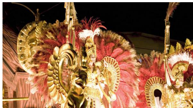
Carnaval en la ciudad de Las Tablas

Esta festividad de Panamá termina el martes en la noche con el entierro de la sardina. Los más famosos son el Carnaval de Las Tablas y La Villa de los Santos en la provincia de los Santos; también son famosos los carnavales de Ocú y Chitré, en la provincia de Herrera; Dolega en la provincia de Chiriquí; en Penonomé, en la provincia de Coclé; y en la Ciudad de Panamá.