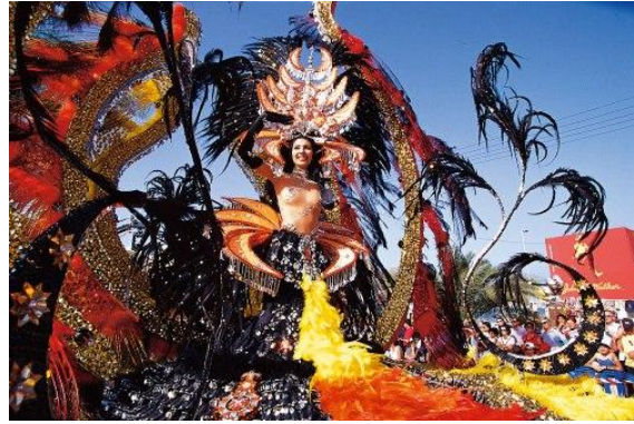
Carnaval de Santa Cruz de Tenerife

Según historiadores, los orígenes del Carnaval, se remontan a las antiguas Egipto y Sumeria de hace unos 5.000 años. Y era basada en la veneración de alguna divinidad. Suele durar unos 3 días en que la gente se disfraza. En España el carnaval se celebra en multitud de pueblos y ciudades, en especial en Canarias y en Andalucía.