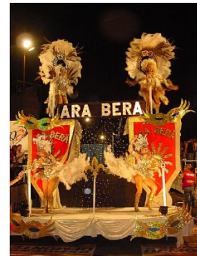
Comparsa Ará Berá

La ciudad de Corrientes es la Capital Nacional del Carnaval; los desfiles tienen lugar en un Corsódromo y su fiesta carnestolenda es considerada entre los mejores carnavales del mundo junto al de Rio de Janeiro, Niza, Gualeguaychú, Venecia y Nueva Orleans. Se destacan las comparsas Ará Berá y Sapucay.