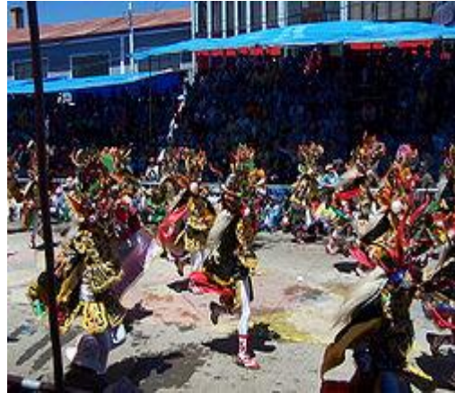
Representación de la Diablada en el Carnaval de Oruro

En la fiesta del carnaval participan cerca de 30.000 bailarines y cerca de 10.000 músicos y la duración de la entrada del carnaval es aproximadamente de 20 horas. La principal de estas danzas es la diablada, aunque también destacan los Caporales, la Morenada, los Suri-Sicuris, la LLamerada, la Kullawada, los Waca-Waca, Pujllay, Tinku, entre otros.