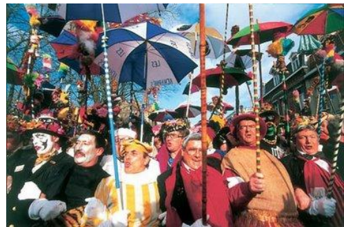
Carnaval de Dunkerque

Esta tradición perduró y los habitantes se apropiaron de la celebración. Aquí todo el mundo saca su clet'che (disfraz) más sofisticado y colorido - inicialmente se confeccionaba con restos de telas o incluso con sacos de patatas.