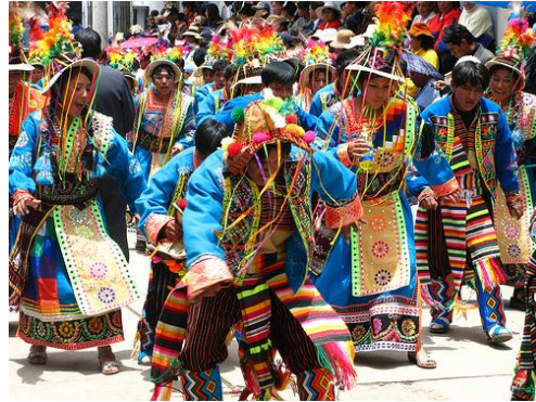
Carnaval de Puno

La Capital del Folclore Peruano, por su inmensa variedad y riqueza de expresiones folclóricas, comienza su agitado mes de Febrero con la Celebración de la Virgen de la Candelaria, que es la más importante del Departamento, inmediatamente seguida por la Semana Turística de Puno y el Carnaval Puneño, fiestas esperadas durante todo el año.