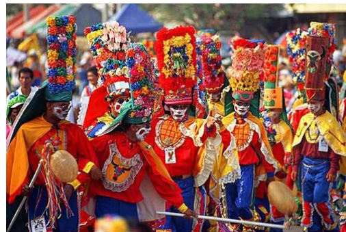
Carnaval de Barranquilla

El carnaval nace de la fusión entre las antiguas fiestas paganas y la tradición católica. Es un evento en donde la fiesta y el jolgorio es lo principal, antes de entrar en el tiempo austero de las penitencias cuaresmales. En el carnaval, la gente se disfraza en un acto de diversión y de desinhibición.