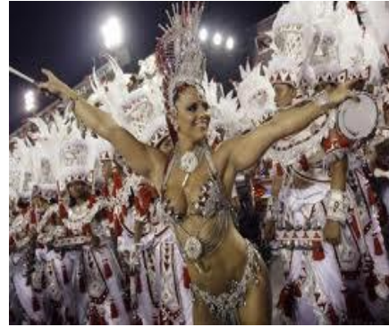
Carnaval Rio de Janeiro

El Carnaval de Río proviene del carnaval europeo. Es aquel tiempo de esparcimiento, previo a la Cuaresma cristiana, que se convirtió en fiesta desenfrenada antecediendo a un periodo de recogimiento que desemboca en la Semana Santa. En Europa ya existían los carnavales antes de que los inmigrantes portugueses los trajeran consigo a Brasil en el siglo XVII, hoy se percibe claramente la influencia de aquellos carnavales europeos en forma de desfiles urbanos con máscaras y disfraces.