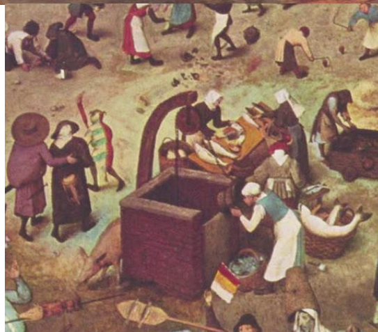
El combate entre don carnaval y doña cuaresma