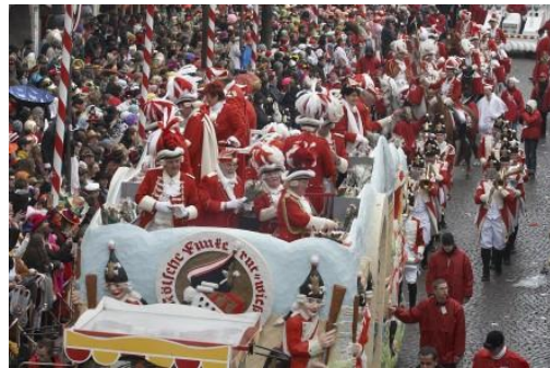
Carrozas en el Carnaval de Colonia

Con la pulcritud milimétrica que les caracteriza, los alemanes de Colonia comienzan los preparativos de su carnaval el día 11 del mes 11, a las 11:11 horas. Su celebración, no obstante, tiene lugar a finales de Febrero o principios de Marzo y tiene una duración de una semana, cuando se traslada a las calles de la ciudad un original festival de carrozas, con más de 170 agrupaciones, que recorren las calles lanzando caramelos y confeti a los espectadores.