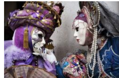
Carnaval de Venecia

Los trajes que se utilizan son característicos de los años 1750 y abundan las maschera nobile , que es una careta blanca con ropaje de seda negra y sombrero de tres puntas.