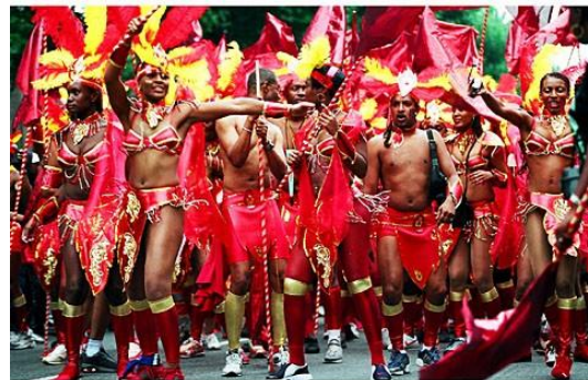
Carnaval de Notting Hill

Desde el año 1965 en Londres, durante el último fin de semana de agosto, en el barrio de Notting Hill tiene lugar el más grande Carnaval caribeño del mundo después lo de Río de Janeiro. Millones de personas de todas las partes del mundo, van a Notting Hill para asistir al desfile de vestidos súper coloreados; el festival fue una idea de los inmigrantes caribeños en Londres (en particular los jamaicanos), para luego transformarse en un auténtico carnaval.