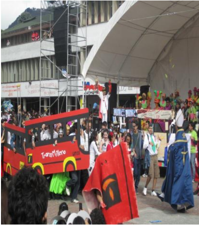
“Transmilenio” en el Carnaval Universitario 2011

Posteriormente en 1965 se intentó revivir el Carnaval, pero en esta ocasión todo volvió a culminar en tragedia, debido a la muerte de un estudiante que sufrió una caída de una de las múltiples carrozas que circulaba por Bogotá.