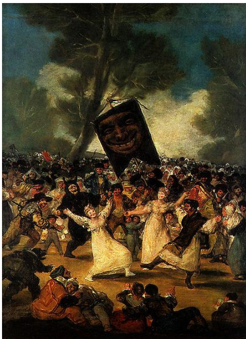
Artista: Francisco de Goya (1746-1828) Descripción: "El entierro de la sardina". Fecha: 1812-1819

Encontrándonos así con que no es la fiesta del carnaval lo que es común a distintos pueblos desde la antigüedad, sino el espíritu de rebeldía, el deseo de cambiar el orden social establecido, es decir, el orden político, económico, moral y legal, por una parte, y por otra, la ratificación del poder establecido que finalmente resulta triunfante por medio del ejercicio del control y la sanción que le permite su fortalecimiento después del tiempo permitido o de permisión.